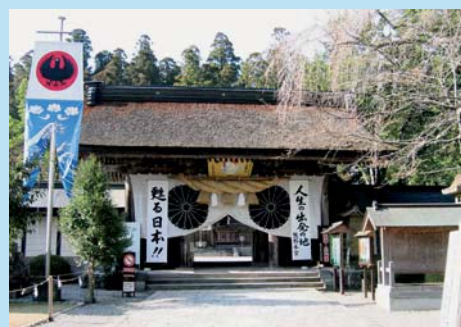
Grote Kumano Schrijn, Hongu

Het serieuze wandelen begint! (plm.21 km, ca. 8 uur) Een korte rit per minibusje brengt ons naar het beginpunt van onze 4-daagse wandeltocht over het Nakahechi pelgrimspad van de heilige Oude Kumano Pelgrimsroute. Vanaf het beginpunt bij Takejiri Oji (een Oji is een tempeltje waar je rust, mediteert en bidt) klimt het pad vrij steil omhoog naar het boven in de bergen gelegen dorpje Takahara. De "Nakahechi" is uitgeroepen tot een van Japans Nationale Historische Paden. De paden zijn duidelijk aangegeven en er zijn op sommige plaatsen stenen gelegd om het klimmen gemakkelijker te maken. Hoewel ze zich nooit vertonen, schijnen er kleine beren in de Kumano bergen te zijn. Wie zich wel af en toe laten zien, zijn herten en everzwijnen. Enkele keren stoppen we en rusten we wat bij schrijnen langs de weg. Enorme cederbomen rond de kleine tempel bij Nonaka no Ipponsugi markeren het einde van onze eerste wandeldag. We brengen de nacht door in een platteland-minshuku waar het avondeten rond de open haard (irori) geserveerd wordt.