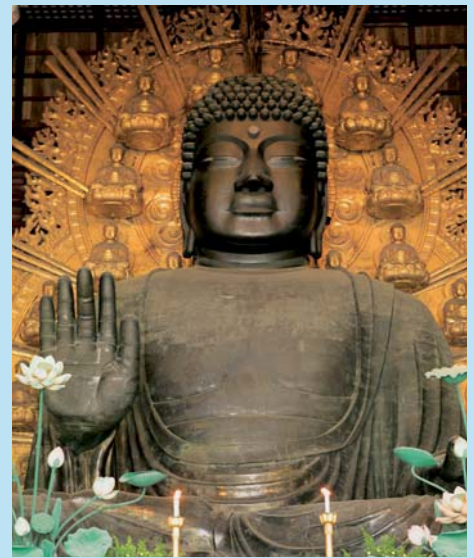
Grote Boeddha, Nara

Vandaag wandeling in het Nara Park, met gids. Vele van Japans belangrijkste Culturele schatten zijn te vinden in het Nara gebied. Het gebied heeft 8 objecten op de Unesco Werelderfgoedlijst staan. De Todaiji tempel, de Nigatsu-do en Sangatsu-do halls, de