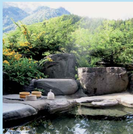
Shin Hotaka Spa

We boeken het graag voor u. De machtige Yariwake- en Hotakadake bergen nodigen u uit.