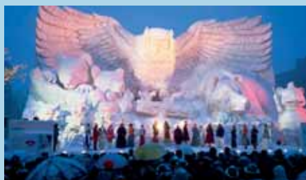
Sapporo Snow Festival

Het Shiraoi Ainu Museum, (ook Porotokotan genoemd), is een van de betere Ainu Musea op Hokkaido. Ainu cultuur en manier van leven wordt buiten getoond in een reproductie van een klein Ainu dorp en binnen in een gewoon museumgebouw. Verschillende voorstellingen zoals traditionele Ainu dansen, worden de hele dag gehouden. Het Shiraoi Ainu museum is 5 stations ten Oosten van Noboribetsu per lokale trein. Enkele reis duurt ongeveer 30 minuten en kost ca. 350 Yen. Let erop dat er slechts om de 2 uur een trein gaat.