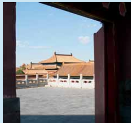
Verboden Stad, Peking