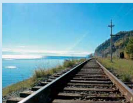
Baikal meer, Irkutsk

Treinschema's in Rusland, Mongolië en China, vooral de trajecten Irkutsk - Ulan Bator - Peking veranderen nogal eens; het schema kan daardoor iets korter of langer worden. Hetzelfde geldt voor de bootschema's Shanghai - Japan. Dit kan invloed hebben op de reisomstandigheden.